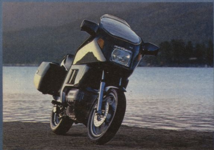
BMW K 100 RT