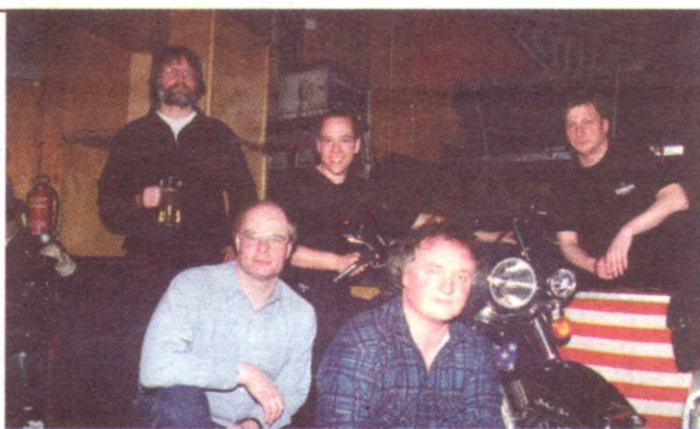
Sorgt für gute Stimmung: die „Chill Out Blues Band“ aus Hannover !