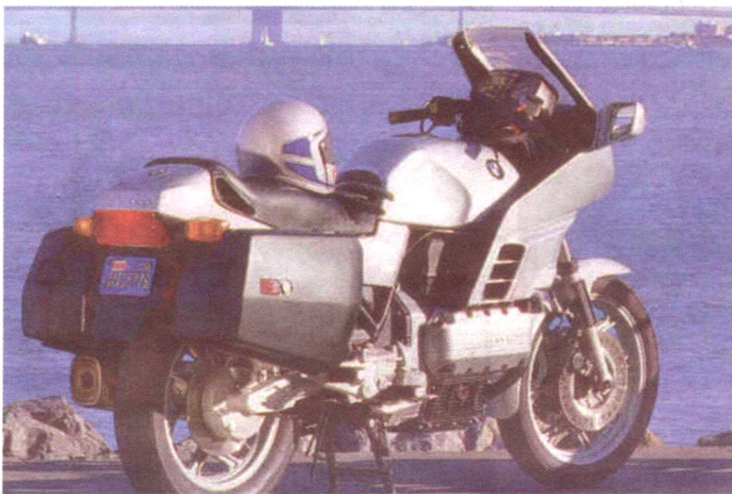
Schon ein Klassiker: BMW K100 RS von 1983

Kaum jemand weiß, dass die Drei- und Vierzylinder von BMW inzwischen schon auf eine über zwanzigjährige Geschichte zurückblicken: 1979 wurde der Grundstein für die Modellreihe gelegt, die in den achtziger Jahren das Überleben der Motorradsparte bei BMW sicherstellte und in der K1200-Serie ihren vorläufigen Höhepunkt erreicht. 1983 waren dann die ersten K100 erhältlich. Gleich fünfmal hintereinander wählten die Leser der Zeitschrift „Motorrad“ die K100 zum „Motorrad des Jahres“ – bis im sechsten Jahr die sportlich designte K1 diesen Titel errang !